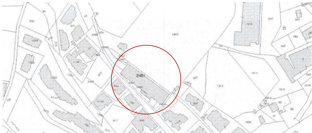
Stralcio foglio catastale n. 74, p.lla 2461

Il bene in esame risulta essere rappresentato nello stralcio dell'estratto di mappa catastale in scala originale 1:2000, Sezione Censuaria Tivoli, Foglio 74, Mappale n.° 2461: